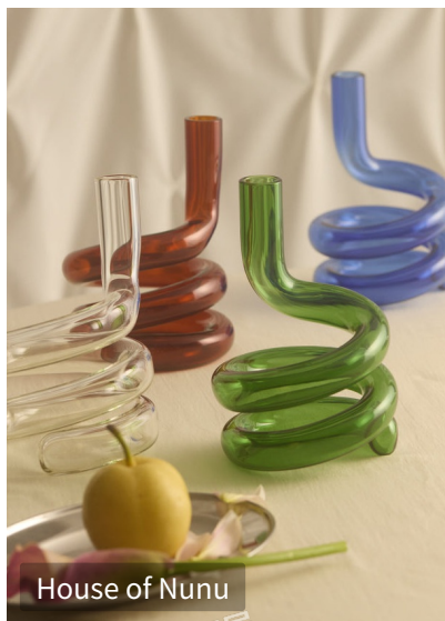
House of Nunu