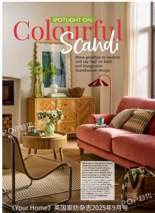
《Your Home》英国家纺杂志2025年9月号