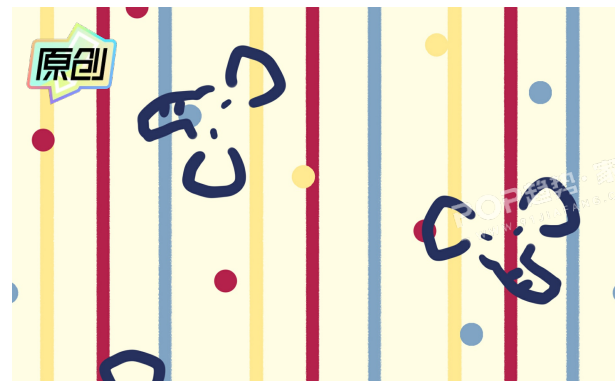
宠物元素图案参考入口 🔗