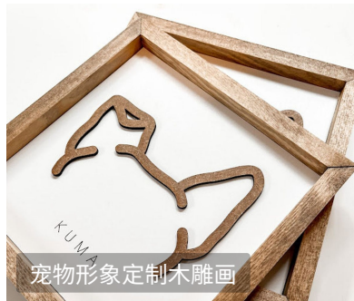
宠物形象定制木雕画

宠物写真逐渐成为宠物“亲情化”趋势下的新兴消费形式，满足养宠人的情感留存需求。宠物写真、宠物亲子摄影在城市中产与年轻养宠群体中形成稳定需求，正成为纪念宠物、延展亲密关系的重要消费环节。