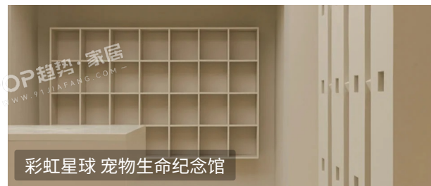
彩虹星球 宠物生命纪念馆

宠物定制化产品丰富多样，涵盖从宠物用品、家居、饰品等多个方面，满足了宠物主对情感表达与专属感的需求。其背后是从标准化到个性化的消费升级，蕴含较大的细分市场潜力。