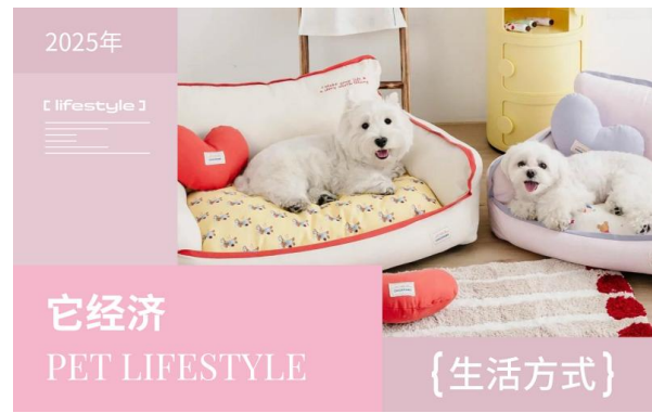
2025年宠物生活方式洞察——它经济 🔗