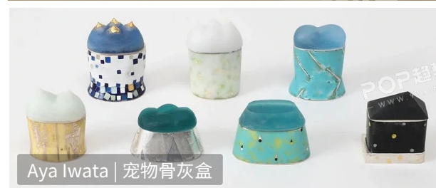
Aya Iwata | 宠物骨灰盒