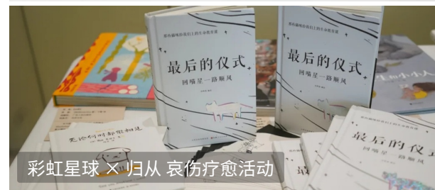
彩虹星球 X 归从 哀伤疗愈活动