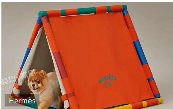
宠物用品参考入口 🔗