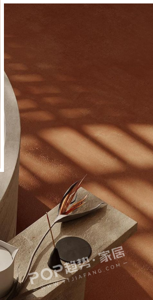
POP 趋势·家居 JIAPANG.COM