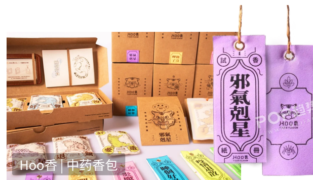
Hoo香 | 中药香包

松弛居家：草木染家居/原木风家居/香薰机/松木香薰片/模块化沙发床/陶瓷香薰炉/无火香薰摆件/多功能瑜伽垫/手工感制品/温感按摩靠枕/音波助眠机/智能床/多场景居家服