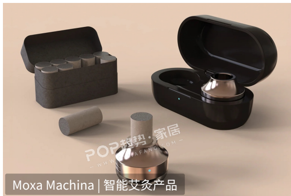
Moxa Machina | 智能艾灸产品