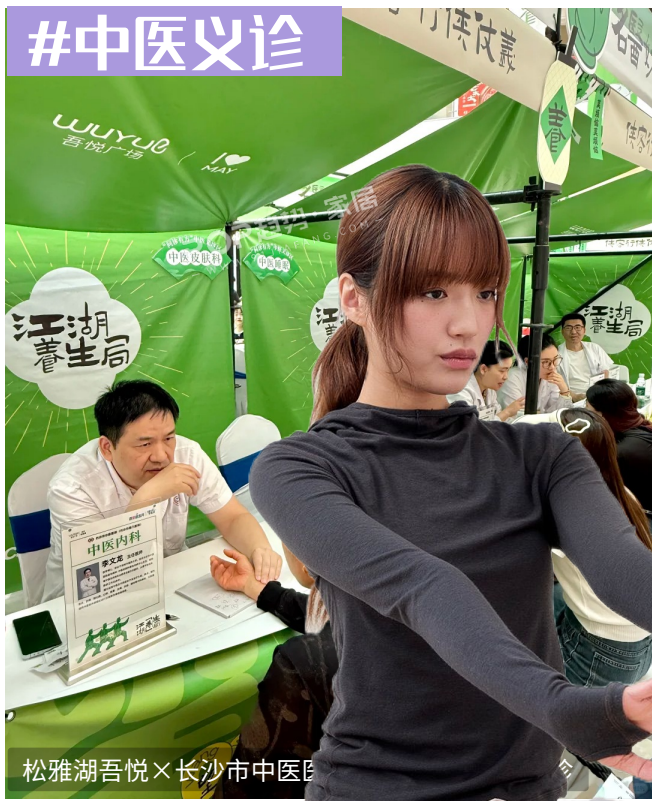
松雅湖吾悦×长沙市中医