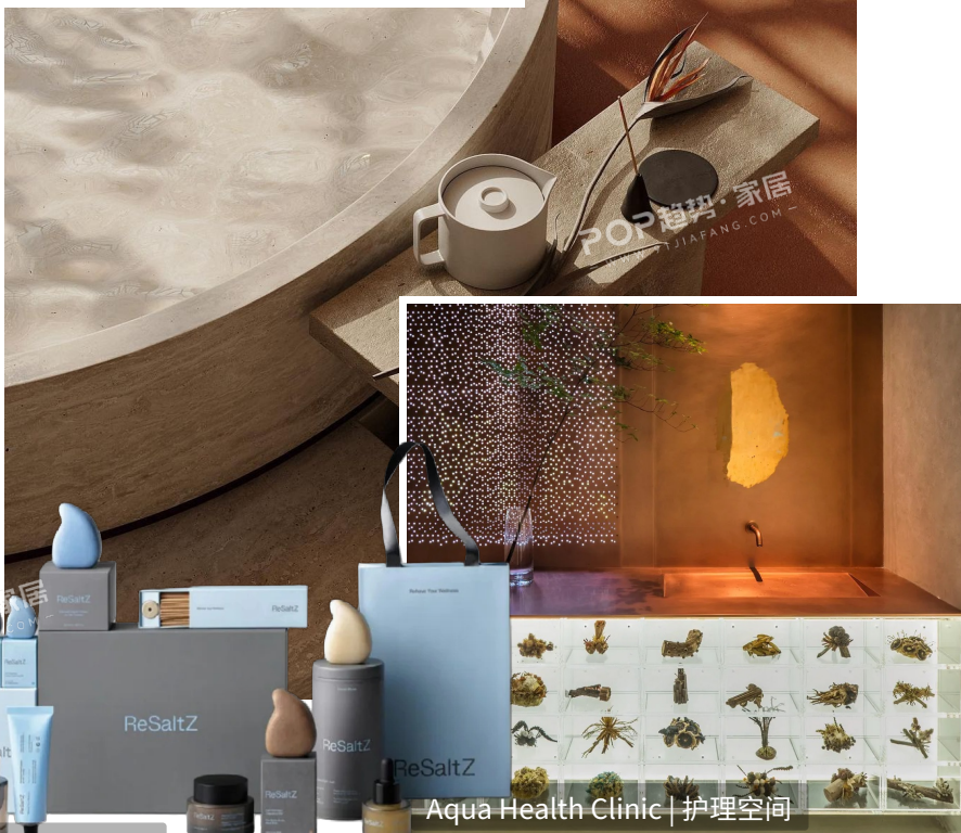
ReSaltZ | 健康个护产品