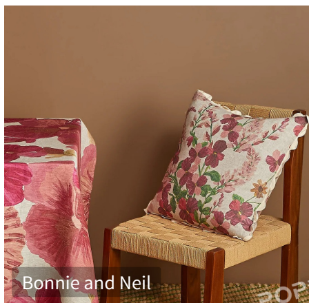
Bonnie and Neil

Bonnie and Neil 以浓烈鲜活的自然美学为核心，将大朵花卉的蓬勃生命力注入家居软装。系列以高饱和撞色与写意笔触重构花植意象，从桌布到抱枕，印花兼具艺术张力与实用质感，复古肌理与明快色调交织，为空间注入热烈松弛的氛围，打造充满生命力的居家场景，尽显自由随性的设计态度。