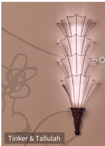
Tinker & Tallulah