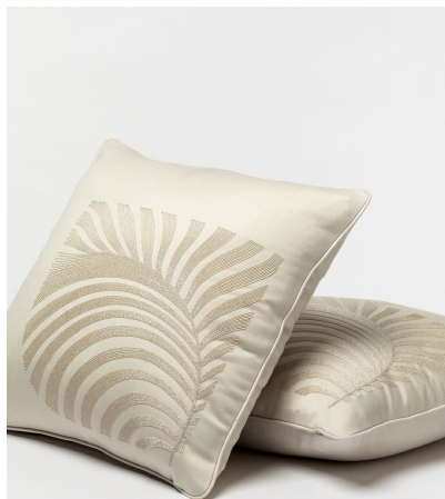
Holland & Sherry