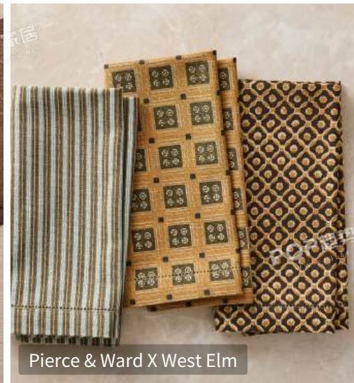
Pierce & Ward X West Elm