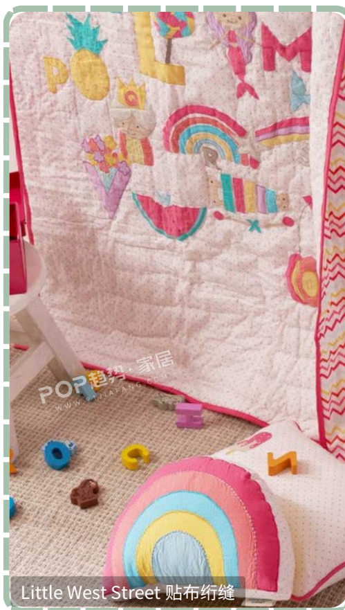
Little West Street 贴布绗缝

彩虹乐章主题下，工艺丰富且极具创意，通过绗缝、拼接、贴布等方式为产品注入活泼氛围与艺术感，满足实用功能同时契合婴童对多彩世界的好奇心理，Kip & Co被子的菱形绗缝以利落线条穿梭面料，赋予精致外观并固定填充，增添结构美，Pottery Barn kids则将多彩面料拼接后用细腻绗缝强化连接装饰，呈现斑斓且富童趣温暖感的视觉效果。