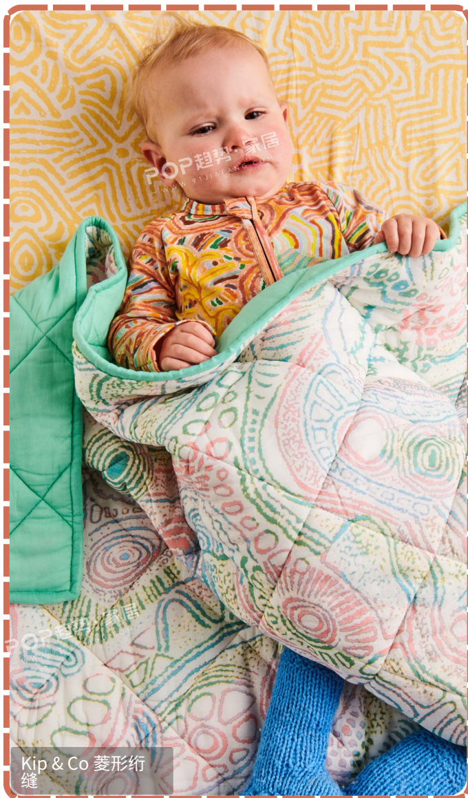
Kip & Co 菱形绗缝