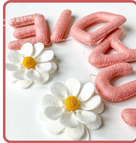
PANTONE 17-1644 TPG 淡珊瑚红