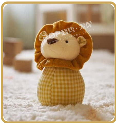
PANTONE 14-0952 TPG 辣芥末

彩虹乐章主题色彩，以鲜活组合构建婴童家纺的梦幻色谱。辣芥末黄如暖阳般明亮，点亮童趣氛围；火烈鸟红热烈俏皮，传递纯真活力；淡珊瑚红温柔柔和，轻触细腻感官；雪白似云朵纯净，浅青瓷色如晨雾清新，尼亚加拉蓝若湖水静谧，多元色彩交融，为婴童家纺晕染出烂漫且治愈的视觉天地，契合宝宝对世界的好奇与想象。