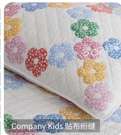
Company Kids 贴布绗缝