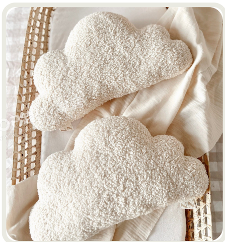
PANTONE 11-0602 TPG 雪白