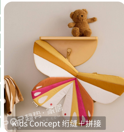
Kids Concept 绗缝+拼接