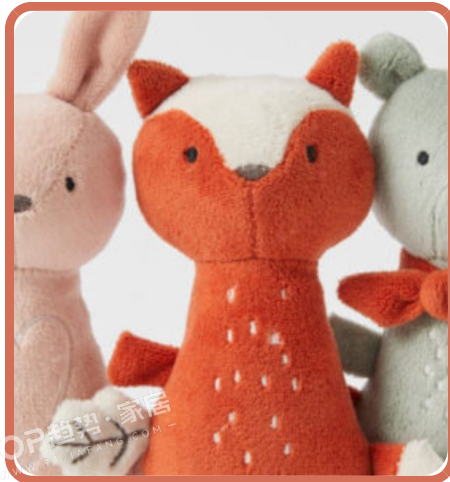
PANTONE 16-1450 TPG 火烈鸟红