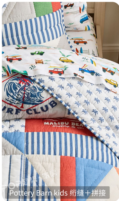
Pottery Barn kids 绗缝+拼接