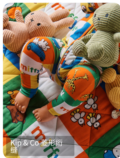
Kip & Co 菱形绗缝

彩虹乐章主题下，工艺丰富且极具创意，通过绗缝、拼接、贴布等方式为产品注入活泼氛围与艺术感，满足实用功能同时契合婴童对多彩世界的好奇心理，Kip & Co被子的菱形绗缝以利落线条穿梭面料，赋予精致外观并固定填充，增添结构美，Pottery Barn kids则将多彩面料拼接后用细腻绗缝强化连接装饰，呈现斑斓且富童趣温暖感的视觉效果。