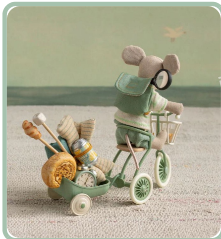
PANTONE 13-6108 TPG 浅青瓷色