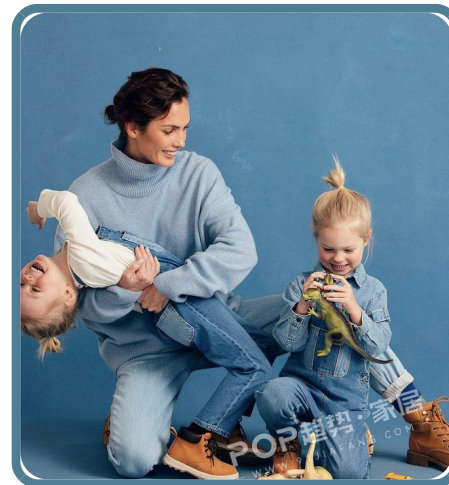
PANTONE 17-4123 TPG 尼亚加拉蓝