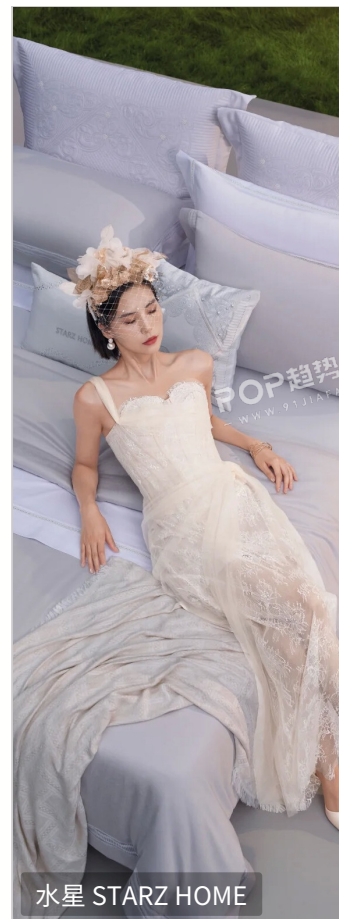
水星 STARZ HOME