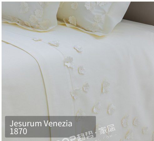
Jesurum Venezia 1870