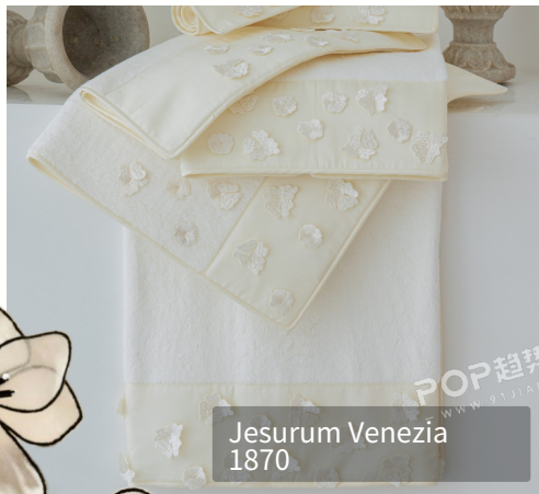
Jesurum Venezia 1870