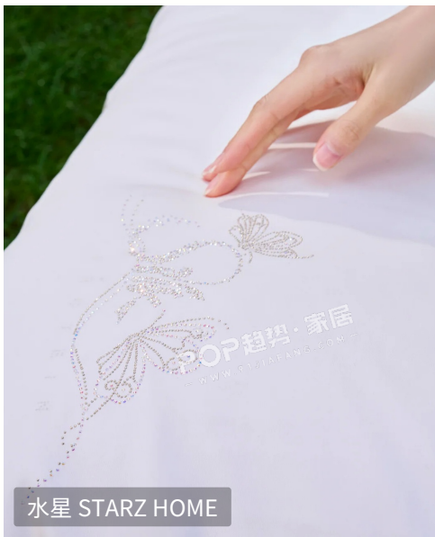
水星 STARZ HOME

作为法式静奢风的点睛之笔，微光饰缀工艺以“克制闪耀”重构春夏家纺的精致表达。着重采用渐变烫钻、雾面钉珠与隐闪金银丝嵌织，打造低存在感的细腻光泽。以奶白、浅驼、雾蓝等低饱和底色为画布，微光元素仅在床品角隅悄然绽放——枕套一角的渐变珠排、被套边缘的细碎钻饰，复刻法式宫廷床品的仪式感。随光影流转，这些细碎微光呈现柔和朦胧的层次，为日常卧室注入优雅精致的氛围，让每一处细节都成为春夏松弛高级感的无声表达。