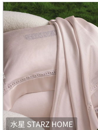
水星 STARZ HOME