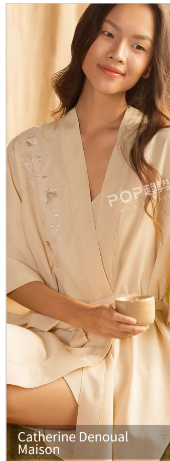
Catherine Denoual Maison

以“轻法式”为设计内核，从“大面积满绣”转向“局部点睛”的克制表达。无论是床品边缘的立体玫瑰蕾丝绣、枕套一角的花鸟枝蔓绣，还是被套上散落的玫瑰刺绣，都以“少而精”的方式呈现。以细腻的同色系或低饱和配色绣线，勾勒柔化的玫瑰、铃兰、飞鸟等法式经典纹样，弱化甜腻感，适配米白、雾杏、柔粉等柔和底色。刺绣细节细腻立体，自带手工温度，在光影下呈现柔和的肌理层次，既延续了法式浪漫基因，又以轻盈克制的表达，为日常床品注入松弛而高级的仪式感。