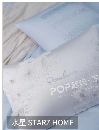
水星 STARZ HOME