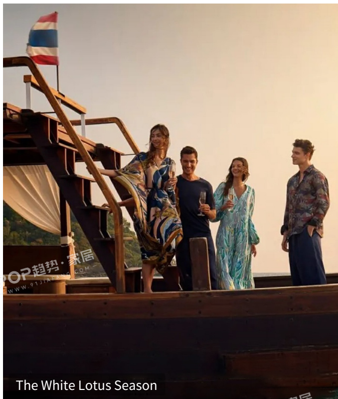
The White Lotus Season