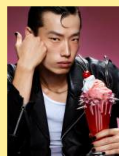
19叛逆漂浮 Rebel Floats