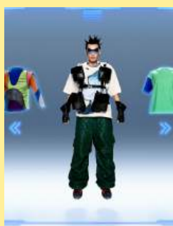
17头号玩家 Player One