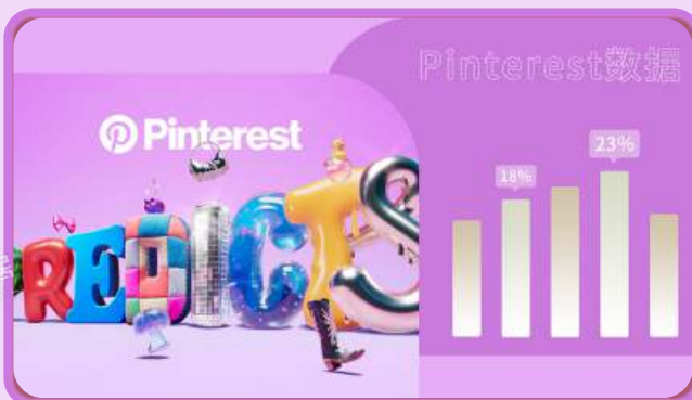
Pinterest 100 | 2024年大数据分析 🔗