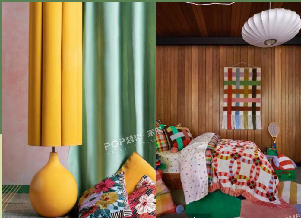
Sage x Clare