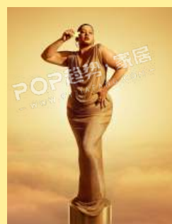
18女神情结 Goddess Complex