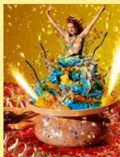
16怪味蛋糕 Chaos Cakes