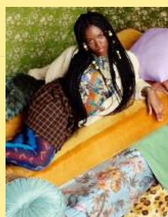
10折衷极繁 Mix & Maximalist