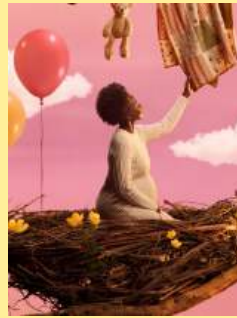
04筑巢派对 Nesting Parties