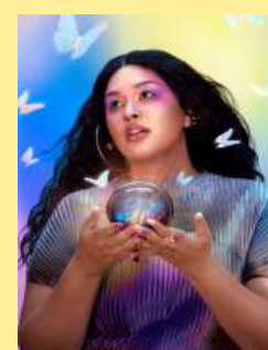
20情绪色环 Aura Beauty