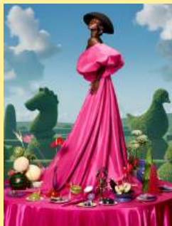
01超现实晚宴 Surreal Soirees