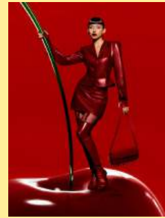
05樱桃编码 Cherry Coded