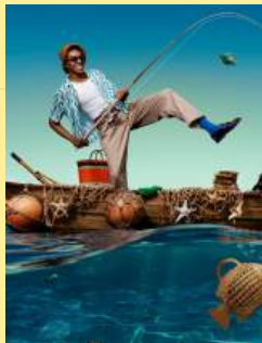
08渔人美学 Fisherman Aesthetic