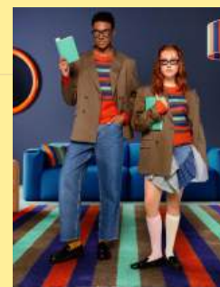
12双人成行 Seeing Double