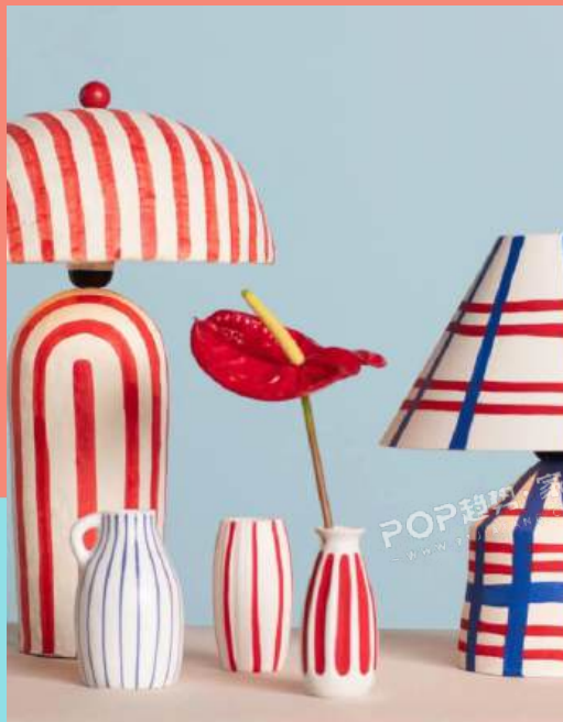
One Kings Lane