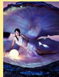
06海之巫妖 Sea Witchery