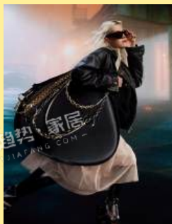
14机车波希米亚 Moto Boho