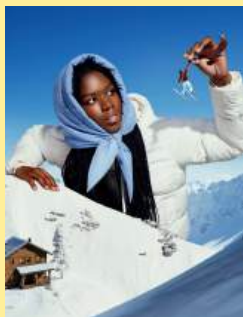
15登峰之旅 Surreal Soirees