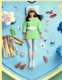
07玩具小屋 Dolled Up