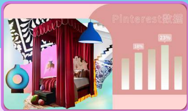
Pinterest 100 | 2023年家居生活趋势预测 🔗