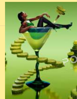
13泡菜修复 Pickle Fix