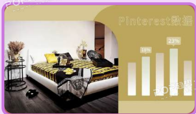
Pinterest 100 | 2022年家居生活趋势预测 🔗