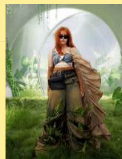
11未来之地 Terra Futura