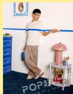
09初级游戏 Primary Play