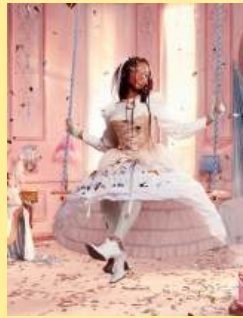
02洛可可复兴 Rococo Revival