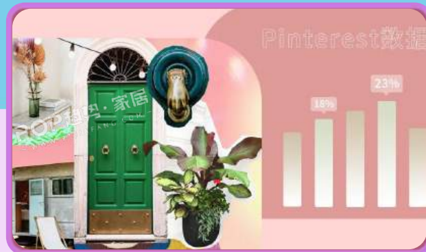
Pinterest 100 | 2023年大数据分析 🔗