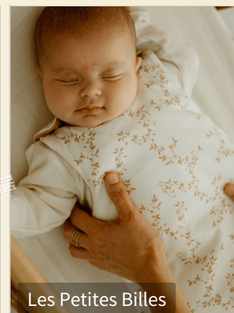
Les Petites Billes