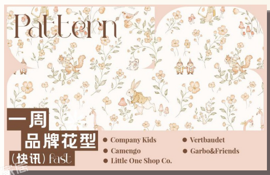
一周品牌花型快讯 (矢量)