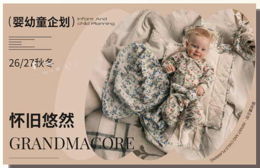
26/27秋冬婴幼儿童家纺企划-怀旧悠然 (矢量)