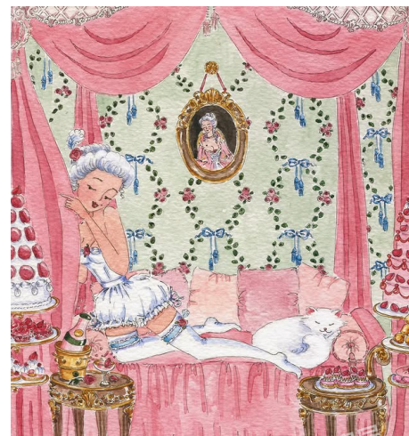
PANTONE 13-1716 TPG