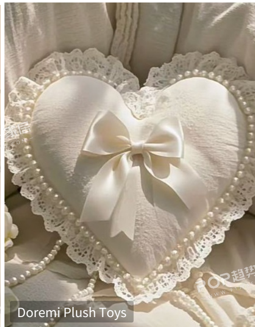
Doremi Plush Toys