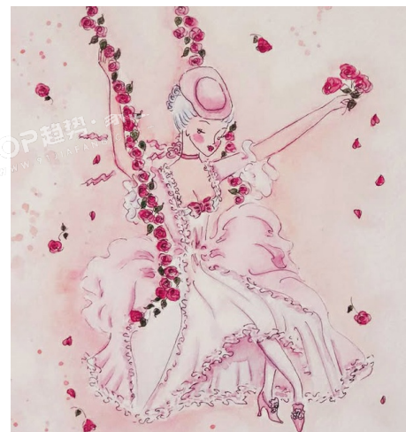
PANTONE 13-3405 TPG