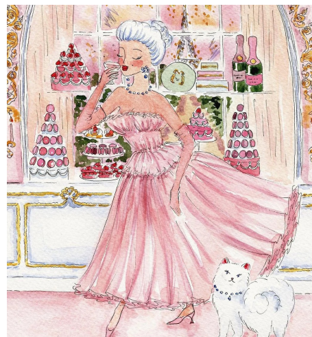
PANTONE 13-1407 TPG