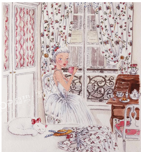
PANTONE 11-0602 TPG