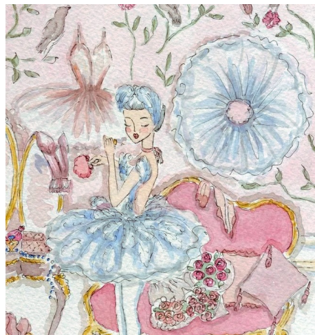
PANTONE 13-4410 TPG

受艺术家Manonboudoir水彩画作的色彩启迪，Manonboudoir以其水彩画的轻快、精致、细腻与繁复，捕捉了那个黄金时代的异想天开，而这些特质被巧妙地转化为了家居装饰的色彩语言。在色彩搭配上纯白雪色、克里奥尔粉、淡雅玫瑰色作为基础主色调，这些色彩不仅致敬了那个时代的优雅与细腻，同时也为现代家居空间带来一抹温柔与宁静。清凉喷雾色作为趋势色，这一清新脱俗的色彩灵感来源于自然中的晨露或夏日微风拂过的瞬间，为家居空间带来一丝凉爽与惬意。而淡雅玫瑰色作为流行色，创造出一种既梦幻又不失高雅的色彩效果，适合追求个性与品味的居住者。