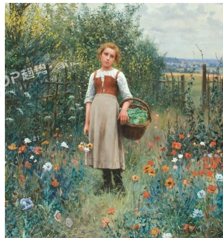
PANTONE 17-4019 TPG