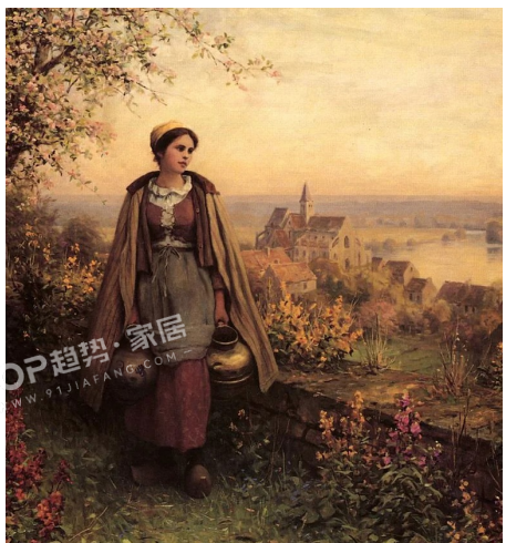
PANTONE 17-1446 TPG