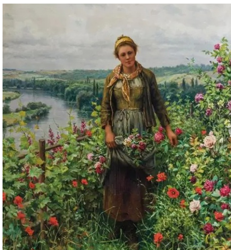
PANTONE 15-6437 TPG