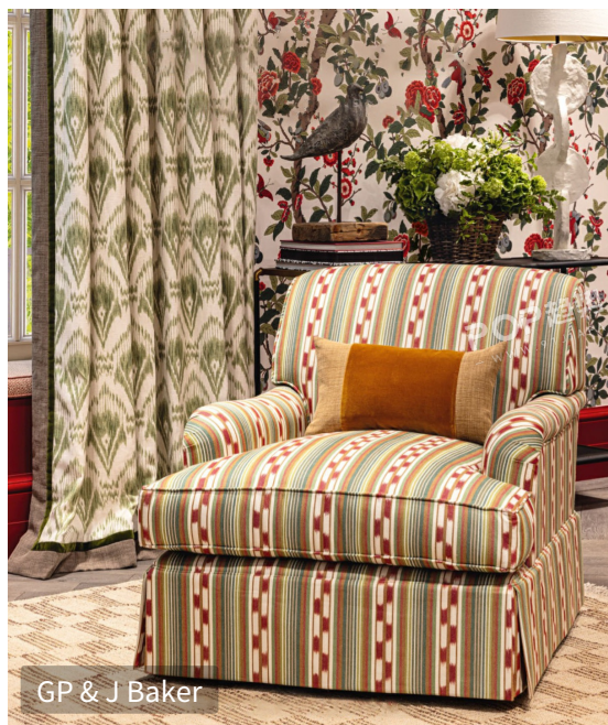
GP & J Baker