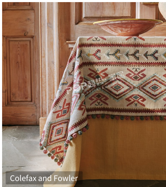
Colefax and Fowler