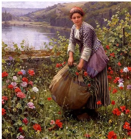
PANTONE 16-1640 TPG

在艺术画家Daniel Ridgway Knight启发的色彩世界里，将这份对乡村生活的浪漫情怀与宁静美好，巧妙地融入到了家居产品设计中，旨在为居家空间带来宁静与美好的自然氛围。色彩上围绕着芒果色、草绿色、凯普莱特橄榄绿为基础主色调。芒果色如同夏日成熟的果实，散发着温暖而明亮的气息。草绿色则如同广袤的田野，清新自然。而凯普莱特橄榄绿则带着一种沉稳与内敛，为家居增添了一份稳重与典雅。珊瑚色作为趋势色，其甜美的色彩，为家居空间增添了一抹浪漫与柔情。而山泉色作为流行色，其清澈透明的质感如同山间清泉，为家居带来了一股清新的气息。