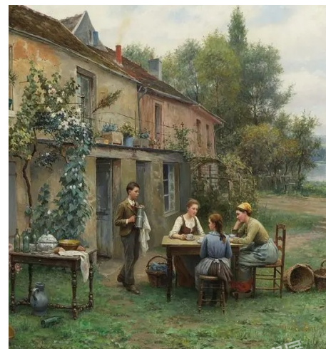
PANTONE 18-0426 TPG