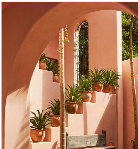
PANTONE 16-1344 TPG 灰橙色