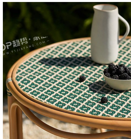
PANTONE 18-0125 TPG 洋蓍绿