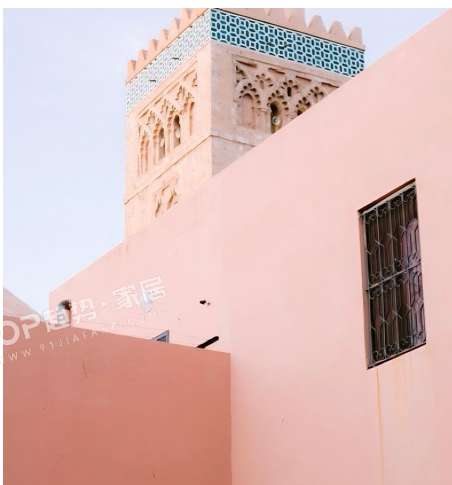
PANTONE 13-1511 TPG 粉盐