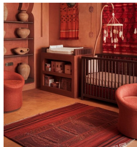
PANTONE 18-1552 TPG 熔岩瀑布