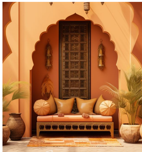
PANTONE 13-0939 TPG 乳金色

"几何民谣"主题以色彩交响重构视觉语言，乳金色、洋蓍绿等色调构建自然与人文的对话场域。乳金色如暖阳铺陈底色，洋蓍绿似新芽破土而出，粉盐色若晨雾轻笼，灰橙色似暮色浸染，熔岩瀑布红则如篝火跃动，五色在明度与饱和度间形成层次递进。色彩既以熔岩红勾勒几何轮廓，又用粉盐与灰橙填充块面，形成视觉焦点与背景的虚实对比。文化意象上，乳金色承载大地质朴，洋蓍绿呼应自然生机，熔岩红暗合部落篝火的热烈，共同转译为现代几何框架下的文化叙事，使色彩成为连接传统与当代的视觉纽带。