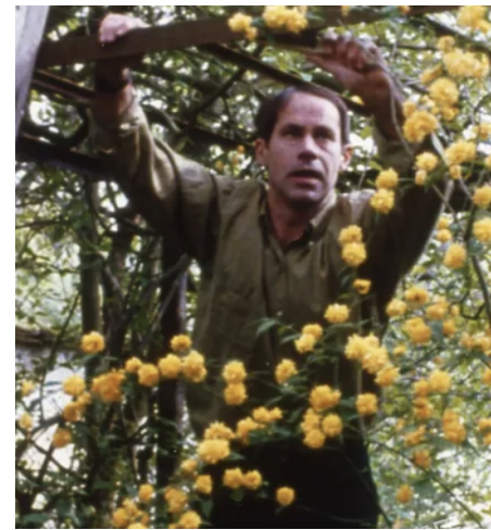
PANTONE 15-0732 TPG