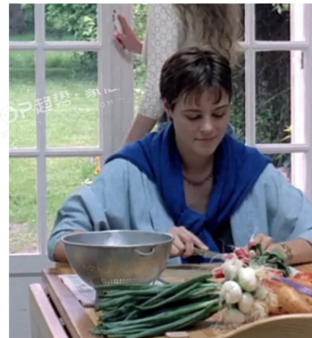
PANTONE 14-3912 TPG