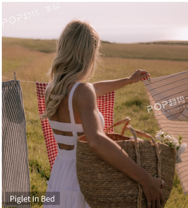
Piglet In Bed