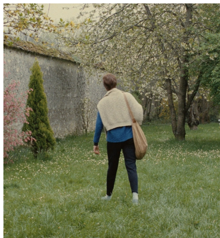
PANTONE 16-0518 TPG