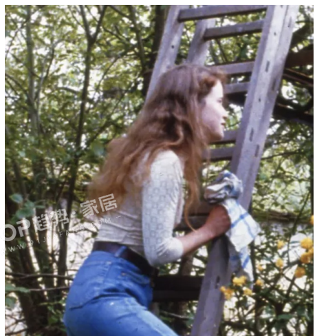
PANTONE 13-0000 TPG