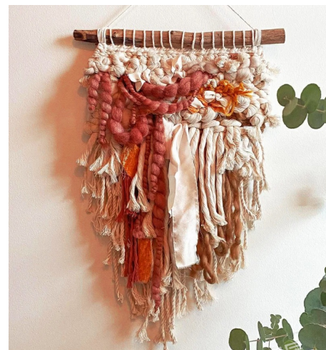
PANTONE 18-1453 TPG