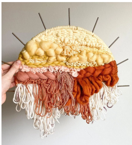
PANTONE 16-1346 TPG