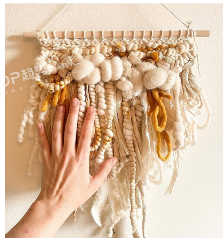
PANTONE 11-1302 TPG