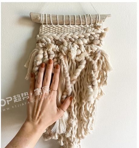
PANTONE 11-4800 TPG