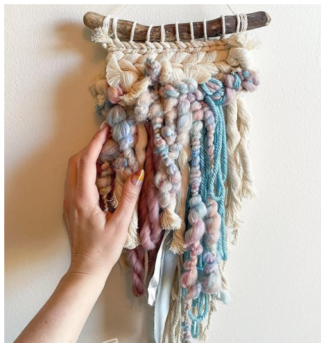
PANTONE 15-4105 TPG

色彩上，深受艺术家Jordan手工产品的色彩启发，Jordan的作品以其丰富的色彩层次和精湛的编织艺术，展现了波西米亚风格的自由不羁与浪漫情怀。运用到家居产品的设计上，围绕着香槟白、金赭色、火焰漩涡红为基础主色调，香槟白，如同晨曦中的香槟酒液，优雅而神秘；金赭色，融合了金色的辉煌与赭石的质朴，为家居空间增添了一抹复古与温暖；火焰漩涡红，炽热而动感，激发着空间的活力与激情。此外，还引入了瀑布蓝作为趋势色，它清澈深邃，如同潺潺流动的瀑布之水，为家居环境带来一抹清新与宁静。而海盐色，作为当下的流行色，其独特的灰色调与细腻质感，为空间增添了一份时尚与高雅。